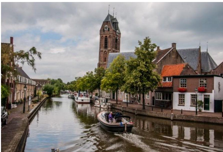
De Hollandse IJssel