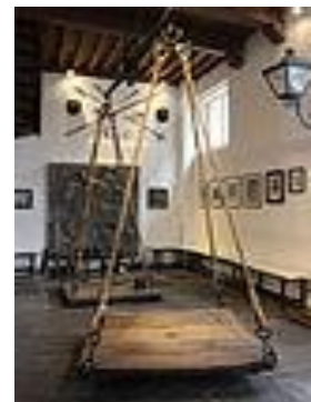
Laat u wegen in de Heksenwaag