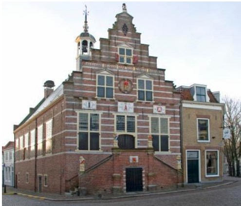
Het stadhuis van Oudewater

Inmiddels gaan we ons richten op wat komen gaat en wel de Voorjaarsbijeenkomst op 14 mei a.s. Deze zal dit jaar gehouden worden in het pittoreske Oudewater aan de Hollandse IJssel. U ziet hieronder een kleine impressie.